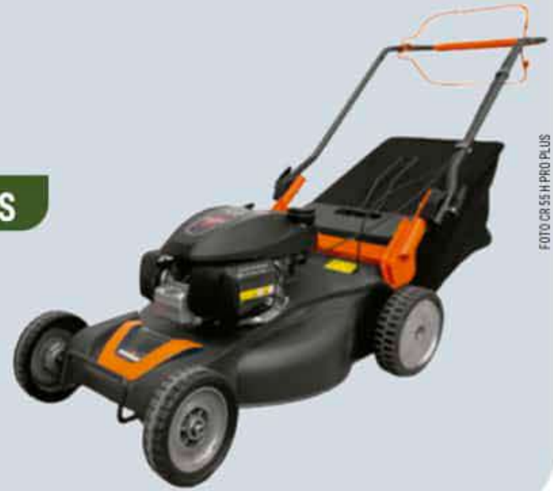
FOTO CR 55 H PRO PLUS