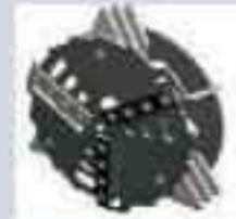
Disco de corte